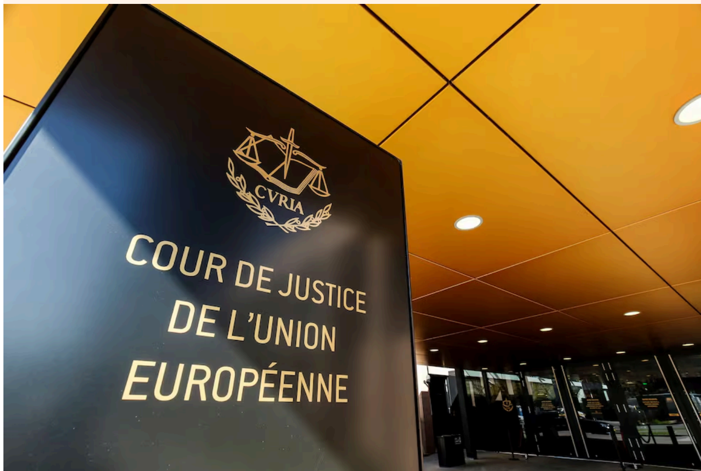
Vista de la entrada del Tribunal de Justicia de la Unión Europea en Luxemburgo.

El derecho comunitario exige que Estados miembros garanticen el derecho de los perjudicados a resarcirse de los daños económicos generados por los citados ilícitos