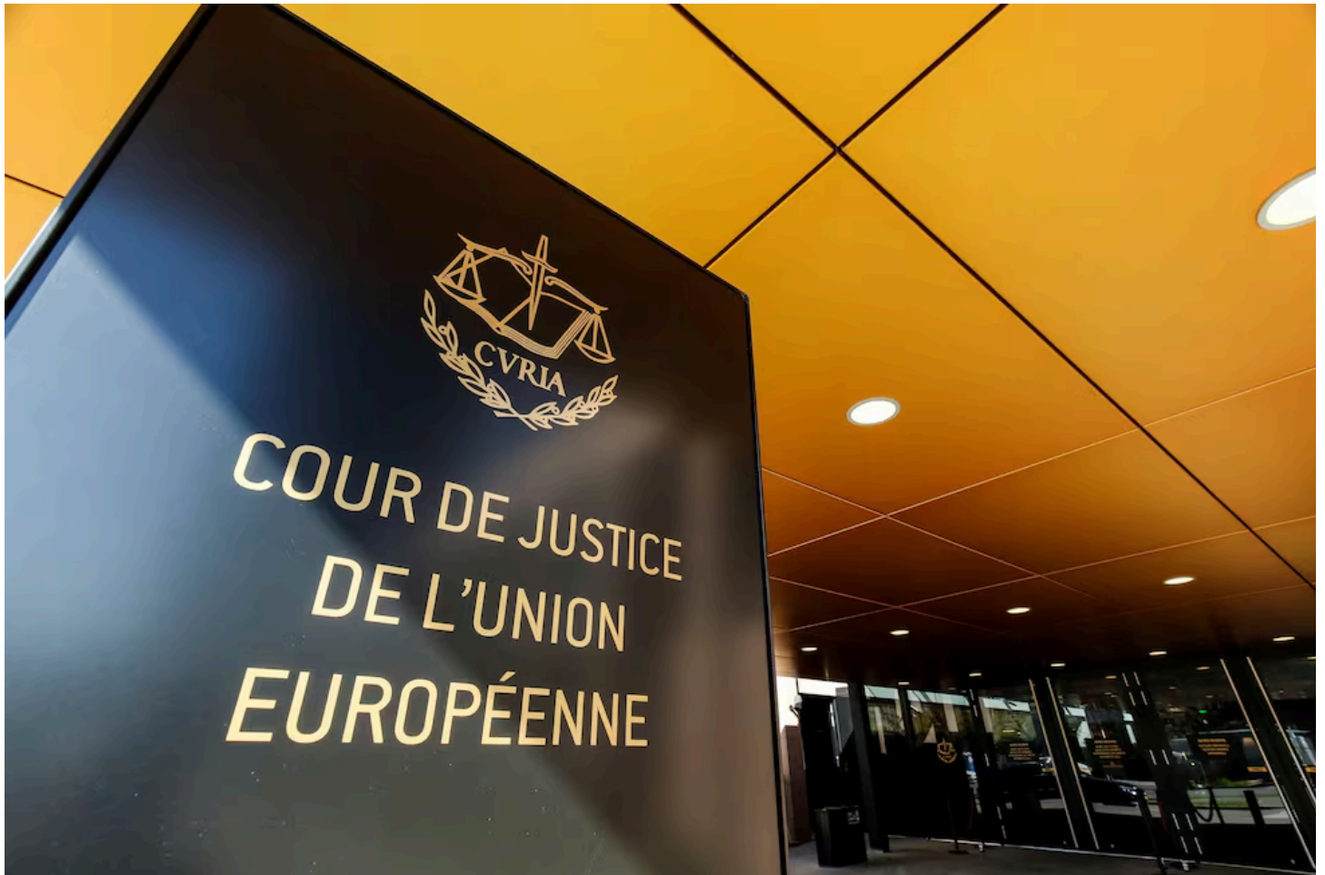
Vista de la entrada del Tribunal de Justicia de la Unión Europea en Luxemburgo.