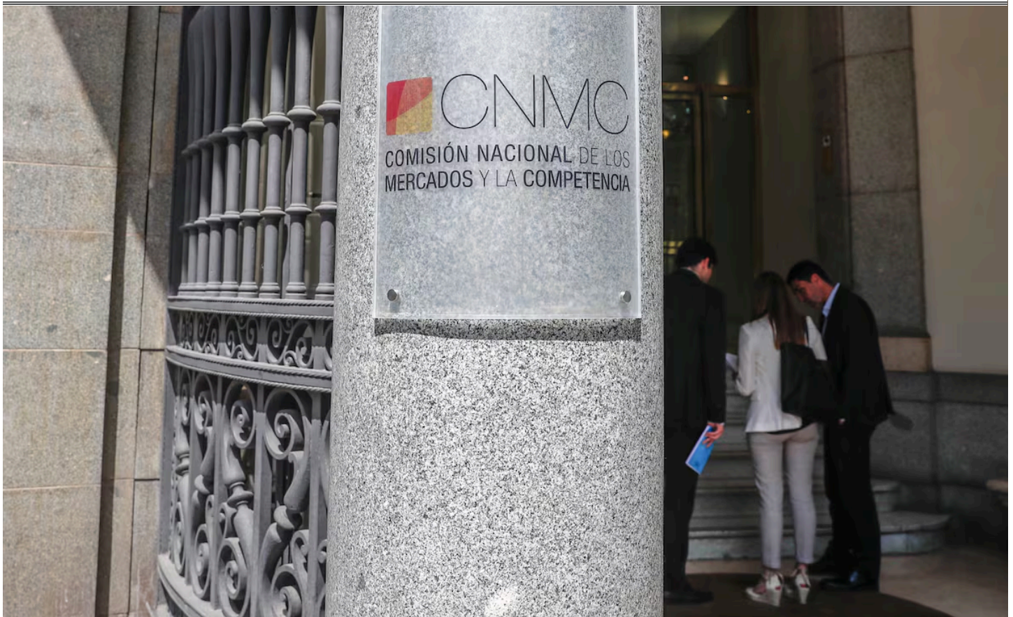
Sede de La Comisión Nacional de los Mercados y la Competencia (CNMC) PABLO MONGE FERNANDEZ